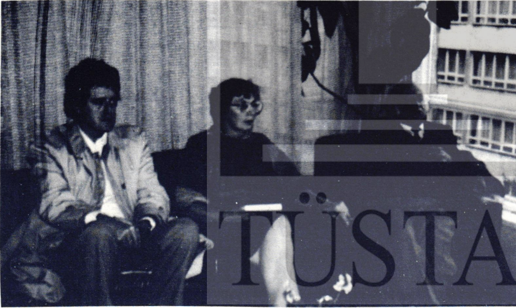
● AVUSTRALYALI KONUKLAR NÜSHED'DE

"Anılan iki yargı kararı dikkate alınarak, Dernek faaliyet ve genel kurulunun gerçekleştirilebilmesi için, Dernek tüzüğü'nün makamınızca onaylanıp tarafımıza gönderilmesi, 2908 sayılı Yasanın 10. ve 13. maddelerinin hükmü gereğidir." □