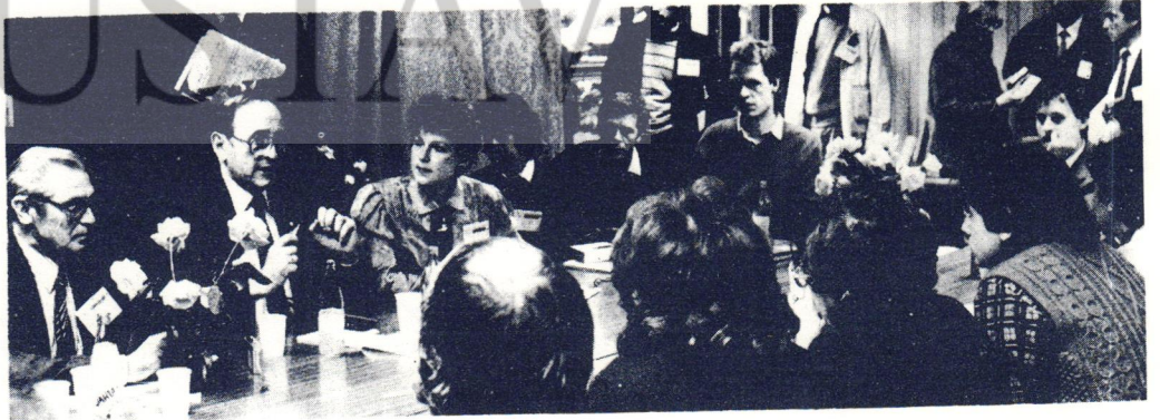
• IPPNW'NİN MOSKOVA'DA YAPILAN 7. KONGRESİ'NDEN BİR GÖRÜNÜŞ...

Uganda Sağlık Bakanı Ruhakana Rugunda, çiçek hastalığının yok edilmesinin öykü-